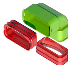
Kit coude vertical AE55SC